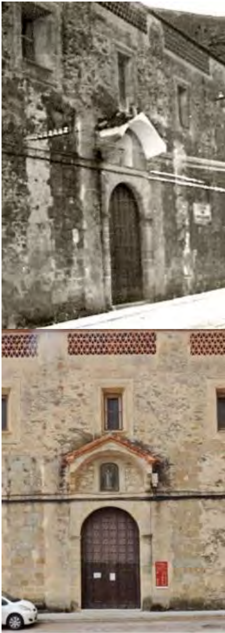
Detalle de foto de 1979 que muestra el convento antes de su restauración y foto posterior a la misma.

La iglesia o ermita 85 de San Miguel tenía testero a la plazuela y entrada lateral por el lado de la Epístola, vale decir, por la calle Tintorerros.