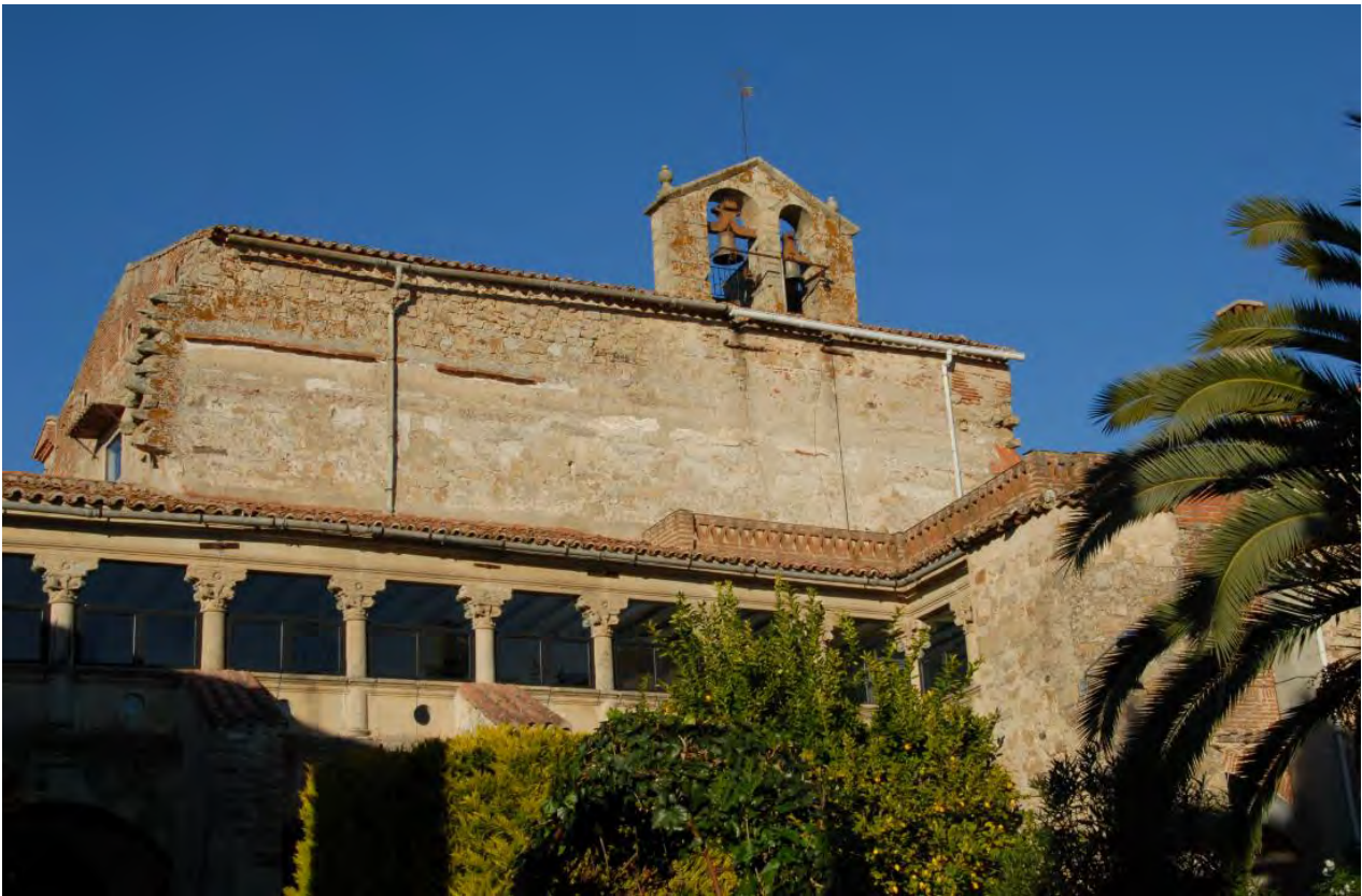
Detalle de la portada del primitivo convento en la Calle Tintoreros